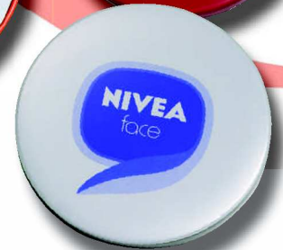
5610 RB 8 cm ø