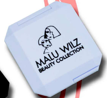
811 R SK 7 x 6,3 cm