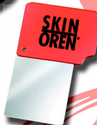
3001 R 6 x 8 cm