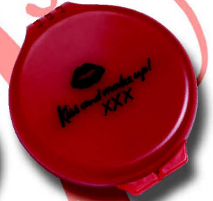
558 R 6 cm ø