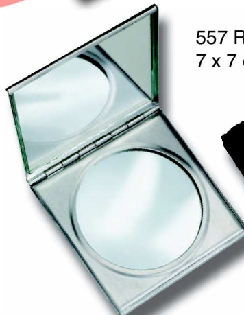
557 RS 7 x 7 cm