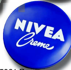
5061 R 6 cm ø