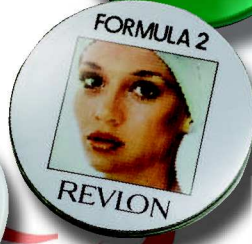
561 RB 6 cm ø