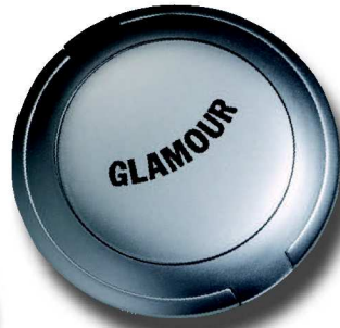
836 R 7,5 cm ø