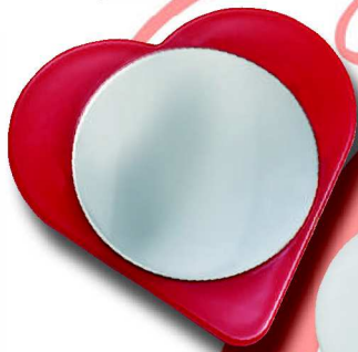
149 R 8 x 6 cm