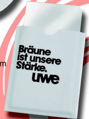
501 R 6 x 8 cm