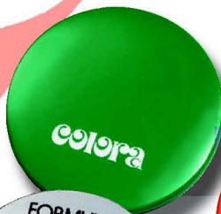
561 R 6 cm ø