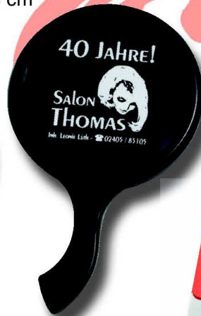
459 R/1 7 cm ø