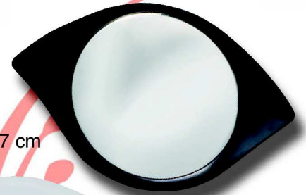
151 R 10 x 6,7 cm