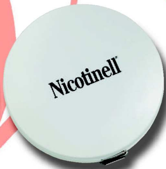
551 R 8 cm ø