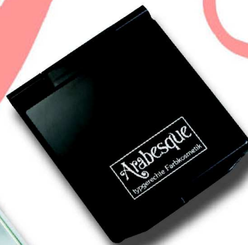
556 R 9 x 8 cm